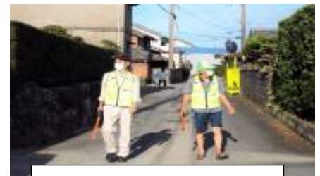
植山地区のパトロール