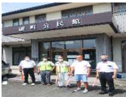
磯地区のパトロール

安心安全委員会では、恒例の夏のパトロールを実施しました。地区によっては自治会と連携して一緒にパトロールをしています。