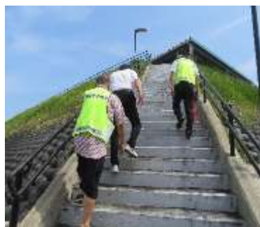
磯：津波避難施設をパトロール