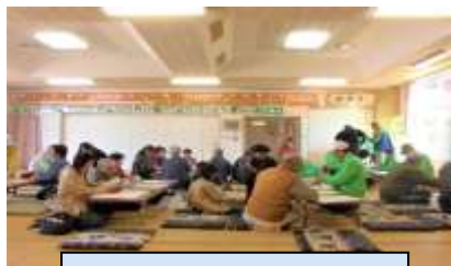
紙で食器作り、おいしかったよ。：上区