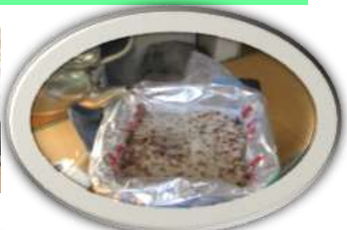
アルファ米に湯を注ぐ

アルファ米を食べるのに、各自が紙を折って食器作りをしたので、苦労しました。アルファ米は保存食とはいえ大変美味しかったと好評でした。