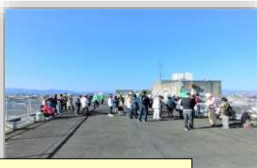
豊西小の屋上：上、森、磯、磯団地