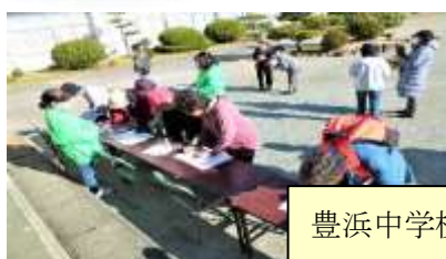
豊浜中学校：森、茶屋前、西豊浜団地、小川