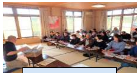
磯町公民館のようす

アルファ米を食べるのに、各自が紙を折って食器作りをしたので、苦労しました。アルファ米は保存食とはいえ大変美味しかったと好評でした。