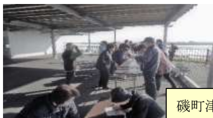
磯町津波避難施設：磯