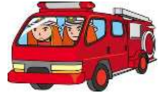
訓練本部のようす