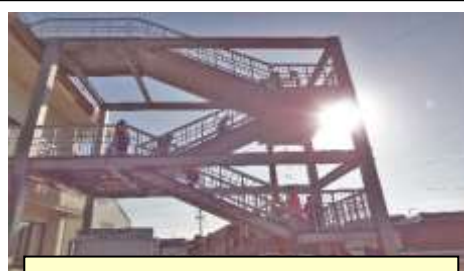
小川町民会館の避難階段：小川