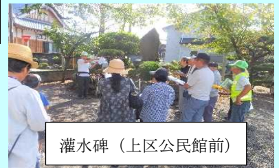
灌水碑(上区公民館前)