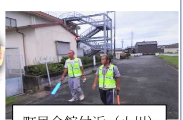
町民会館付近(小川)

当会の防犯防災委員会では、設立当初から毎年、夏休みと年末年始等、各地区に分かれ防犯パトロールを実施しています。地区によって見回り時間や方法は違いますが、どの地区も安心安全なまちづくりをめざして取り組んでいます。【磯と森区は自治会と合同でパトロールを実施しています。】