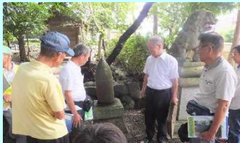
豊玉神社にある日露戦争砲弾