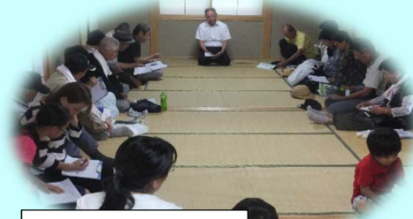
豊玉神社の宮司さんからお話を伺う