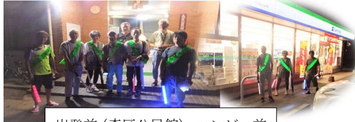
出発前(森区公民館)・コンビニ前