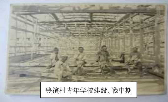
豊濱村青年学校建設、戦中期

昭和30年1月1日伊勢市に合併し伊勢市立豊浜中学校となった。因みに、青年学校とは明治中頃の「実補」、大正15年以降の「青訓」が昭和10年に統合された、小学校卒業後の勤労青少年を対象にした教育機関であった。